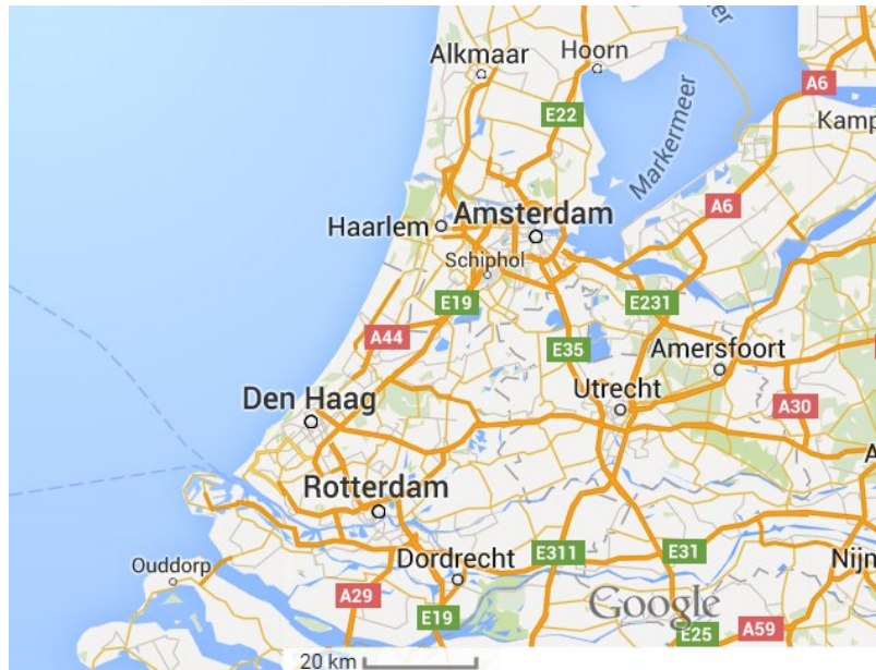
Imagen 6: Localización de Utrecht y demás ciudades de los Países bajos

Utrecht (330.772 habitantes) es la quinta ciudad por población de los países bajos y capital de la provincia que lleva el mismo nombre. La ciudad está situada en el centro del país actuando como núcleo ferroviario entre el Norte-Sur y Este-Oeste del país. Está situada a tan solo 53 kilómetros de la capital, Ámsterdam.