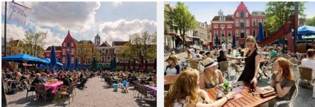
Imagen 7: Plaza de Neude

Utrecht es una ciudad universitaria con lo que por el centro de la ciudad siempre hay ambiente los fines de semana (Sobre todo de cara a la primavera-verano). Cuando empieza el “buen tiempo” en el centro los bares sacan las terrazas (con calefactores e incluso mantas) y el centro cobra vida. Un ejemplo es el de la plaza de Neude , una de las mayores con terrazas.