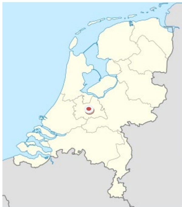
Figura 3. Situación geográfica de Utrecht

En la actualidad Utrecht es una ciudad multicultural, la proporción de habitantes de origen extranjero es aproximadamente un tercio del total, aproximadamente 100.000 residentes son de origen no holandés y acoge a numerosa población estudiantil lo que favorece el ambiente internacional.