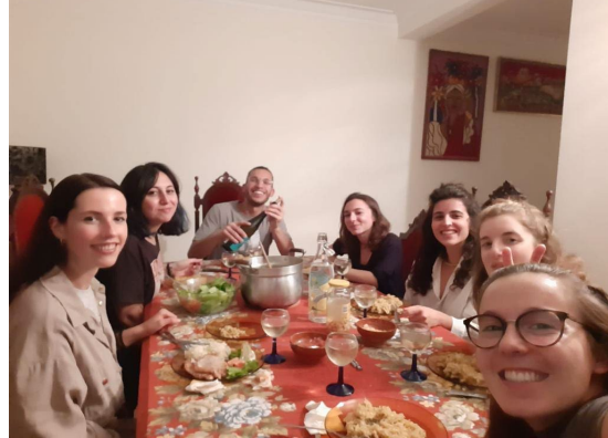
Figuras 46 y 47. Cenas con los colegas de trabajo.

En algunos de los viajes pude probar los platos más típicos de Portugal como lo son la famosa Francesinha en Oporto o la Bifama y los Pasteiges de Belém en Lisboa (Figs. 52, 53 y 54). Uno de mis planes favoritos era desayunar o merendar en la panadería-pastelería que hay en la plaza Deu-la-Deu un riquísimo zumo de naranja y croissant de crema: