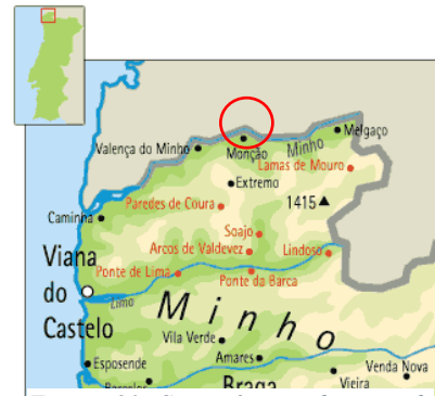
Figura 31. Situación en el mapa de Monção.

El municipio de Monção se encuentra en el norte de Portugal y pertenece al distrito de Viana do Castelo. El río Miño separa este pueblo de España haciendo frontera con la provincia de Galicia. El clima general es frío y lluvioso además de húmedo por su proximidad al río, aunque al ir en los meses de verano tan a penas ha llovido y he podido disfrutar de muchos planes al aire libre. De todos modos, aconsejo llevar ropa de abrigo. He de decir que no he pasado un calor asfixiante en todo el verano, incluso algunas noches refrescaba. La temperatura era ideal.