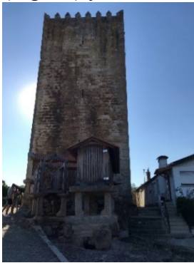
Figura 36. Torre de La Pela.