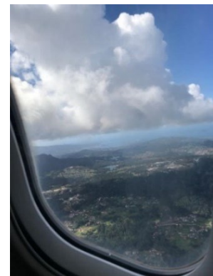
Figura 32. Vistas desde el avión de Vigo.

Monção tiene estación de autobuses pero no de tren. Por lo tanto, para desplazarse a otros lugares de la zona hay que ir al municipio portugués de Valença que está a unos 20 minutos y donde se encuentra la estación de tren. El tren tiene muchas combinaciones y por un bajo coste se pueden ir a visitar sitios como Oporto. La playa está muy cerca, en unos 20 minutos en