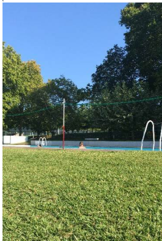
Figura 34. Piscina de verano.

Lo que más me ha gustado hacer en Monção en mi tiempo libre es ir por el río a correr y a pasear (Fig. 33). Es muy agradable caminar por la muralla fortificada y las pasarelas de madera. Se trata de un camino precioso lleno de vegetación que es ideal para hacer ejercicio o desconectar. Además, al pasar el puente Internacional se encuentra el pueblo gallego Salvatierra de Miño, el cual también cuenta con un mirador y restos de la antigua muralla similar a la de Monção. Se pueden hacer actividades acuáticas en el río y pasear junto a él. También hay un parque muy grande con aves de muchos tipos.