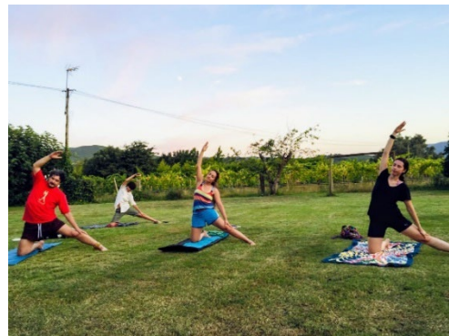
Figura 38. Practicando yoga al aire libre en la casa de unos amigos: Quinta da Teimosa.

Pude viajar e ir a algunos sitios como el Parque Nacional de Peneda-Guerês (Fig.44), Caminha, Moledo Praia (donde vi delfines y unos atardeceres increíbles), Oporto o