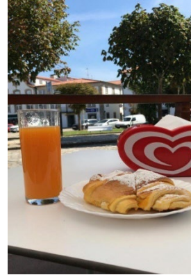
Figs. 48, 49, 50 y 51. Cena de diferentes nacionalidades, bacalhau a broa, chouriço fumeiro y croissant con zumo de laranja.

De esta tierra hay que destacar el Vino Alvarinho . Tuve la suerte de que pudieron venir a verme mis padres y fuimos al Museo del Alvariño donde catamos algunos vinos (Figs. 56 y 57). Me traje algunas botellas a casa además de otros productos de la zona. A si que aconsejo traer espacio en la maleta de sobras.