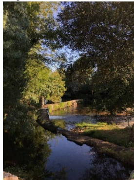
Figura 37. Playa fluvial de Ponte do Mouro.