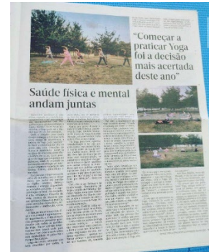
Figura 35. Periódico local donde salí practicando yoga en el río.

(Fig. 34) a la que solía ir muchos fines de semana y algunos días al salir de trabajar. Asimismo, hay unas Termas con aguas curativas, a las cuales pude ir cuando vinieron mis padres a visitarme (Fig. 55). Por todo ello, aconsejo traer ropa de baño. Por otro lado, hay multitud de actividades que se pueden realizar en este pueblo de casi 20.000 habitantes. Me apunté a yoga y algunas veces íbamos al río a practicar al aire libre (Fig. 38), incluso salí en el periódico local (Fig. 35). Hay varios museos entre los que se encuentra el Museo del Vino Alvariño, la Casa Museo de Monçao o el Centro de interpretación de Los Castros. También hay iglesias que merece la pena visitar como la Matriz que se encuentra en pleno centro o el Convento de los Capuchinos. Aconsejo perderse por las calles ya que esconden rincones maravillosos llenos de plantas y encanto. Por otro lado, en las proximidades hay sitios para visitar que merecen la pena como La torre de La Pela (Fig. 36), algunas playas fluviales (Fig. 37) y el Palacio de Brejoeira.