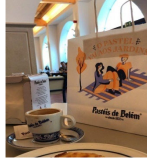
Figs. 52, 53 y 54. Francesinha en Oporto, Bifama y Pastéis de Belém en Lisboa.