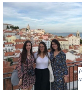
Figura 45. Lisboa con mis amigas.