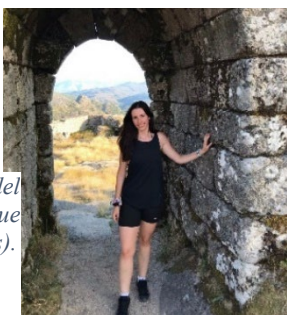
Figura 44. Ruinas del Castillo Laboreiro (Parque nacional de Peneda-Guerês).