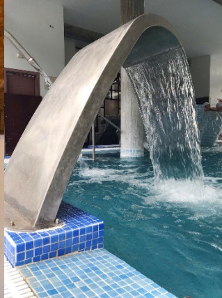
Figs. 55, 56 y 57. Termas de Monção y Museo del Alvarinho con mis padres.

Por último, mis compañeros me dieron este detalle de despedida. Se trata de una ilustración donde salgo yo entre los andamios de la iglesia haciendo yoga. Lo firmaron por detrás y me hizo mucha ilusión. Es un recuerdo que guardaré siempre: